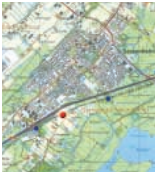
Lokatiestudie halte Sassenheim

Lastdrager is voormalig regiodirecteur NS Randstad regio Zuid en kent daardoor al veel betrokkenen. De samenwerking verloopt dan ook goed, maar: 'de echte uitdagingen ontstaan op het moment dat visies en concepten moeten worden vertaald naar plannen voor investeren en uitvoeren.' Ze ziet voor de komende periode een aantal uitdagingen. 'Stedenbaan moet helder gepositioneerd worden. Dat betreft vooral de onderlinge afhankelijkheid van vervoer en verstedelijking. Stedenbaan is een programma dat een regionaal railproduct aanbiedt op het hoofdrailnet tussen Sassenheim/Hillegom en Dordrecht, Den Haag - Gouda en Rotterdam - Gouda. Dit moet afgestemd zijn op, en gevoed worden door, de verstedelijking waar de Zuidvleugel in de komende jaren voor staat. Deze verstedelijking ligt vooral binnen of bij deze raillijnen. Om Stedenbaan te laten slagen, is afstemming met de verkeersinfrastructuur en het overige OV van groot belang. Het is deze samenhang die van Stedenbaan een lange termijn project maakt met een horizon van zo'n twintig jaar.'